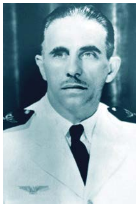
Marechal Casimiro Montenegro Filho Idealizador do ITA