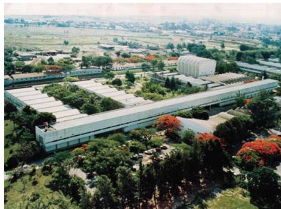
Vista aérea do ITA